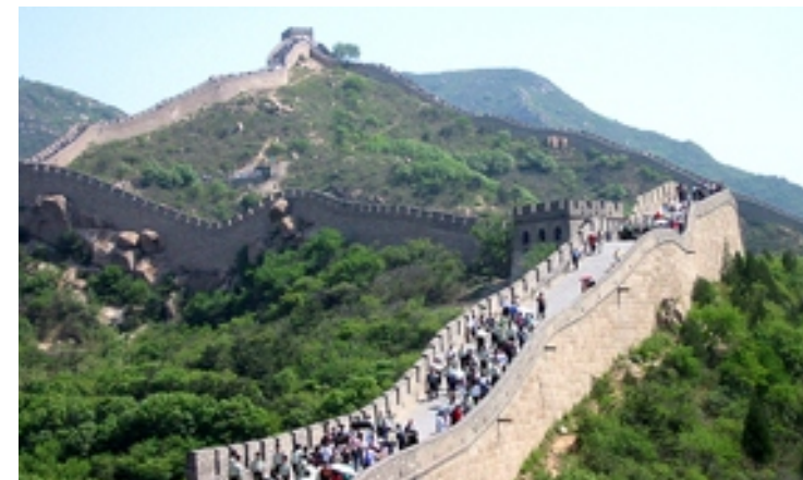
La Muralla China

Actualmente, el estado del patrimonio cultural es preocupante. Su integridad cultural se halla destruida, su patrimonio común está fragmentado en sistemas nacionales cerrados y, en la mayoría de los casos, es poco conocido en el mundo. No existen políticas coordinadas para la protección y promoción del patrimonio. Las crisis económicas, la legislación obsoleta de los países en transición, los conflictos, tanto militares como étnicos, y las catástrofes naturales no solo afectan negativamente sino que ponen en serio peligro al patrimonio cultural que resulta muy vulnerable. La identificación, el estudio y la promoción de los itinerarios culturales deben ayudar a poner fin a este estado de cosas, lanzando y divulgando la idea de este nuevo papel que corresponde al patrimonio cultural y definir, por vez primera, la macro estructura del patrimonio dentro de los itinerarios culturales regionales e internacionales.