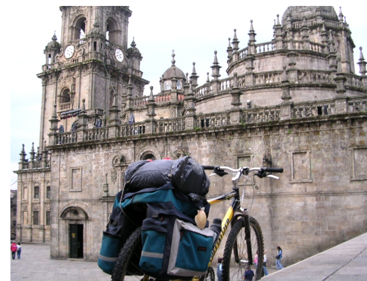
Camino de Santiago

“Los itinerarios culturales históricos no han supuesto únicamente el desplazamiento de los hombres, sino también el de sus ideas, así como el de la política, las guerras y la paz, el mal y el bien. Por las rutas culturales han pasado las misiones religiosas, las caravanas de peregrinos, los viajeros, los invasores y las caravanas comerciales. Estos desplazamientos han jugado un papel muy importante en el enriquecimiento de la civilización y su difusión en el mundo. La civilización, en un sentido amplio, ha sido el fruto de un encuentro universal entre los pueblos y una creación mutua.”