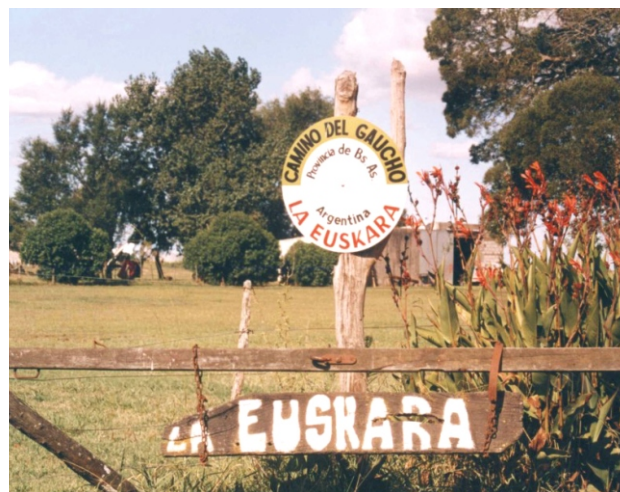
Itinerario Cultural y Corredor Turístico Camino del Gaucho

Si a través del estudio y promoción de un itinerario cultural logramos que esa esencia profunda sirva para construir un espacio de reencuentros, habremos contribuido de forma sustantiva a superar algunos de los grandes lastres que la humanidad aún sigue arrastrando: el racismo, la segregación, la discriminación, el aislacionismo, la falta de solidaridad, las barreras a la información y al conocimiento, etc. A través de los itinerarios culturales entendidos como elementos dinamizadores de la sociedad, el patrimonio histórico puede ser considerado en su dimensión viva, como pilar de desarrollo integral y sostenible".