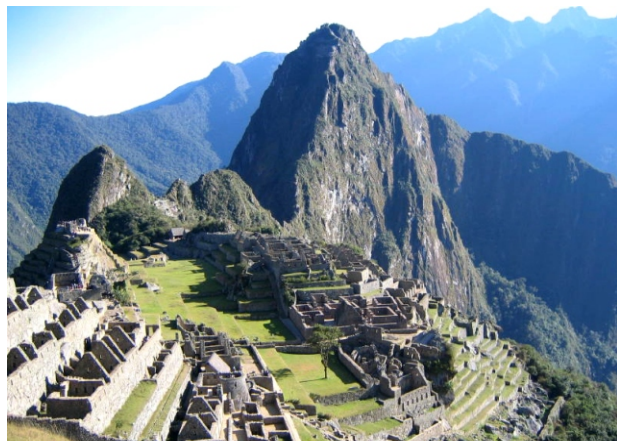
Ruinas de Machu Picchu

La consideración de los itinerarios culturales como un nuevo concepto o categoría patrimonial no se opone a ninguna de las categorías ya consagradas. Antes bien, las reconoce y ensalza, ampliando su significado dentro de un marco más integrador, multidisciplinar y compartido. Tampoco se solapa con otras categorías (monumentos, ciudades, paisajes culturales, patrimonio industrial, etc.) que pueden existir en su seno.