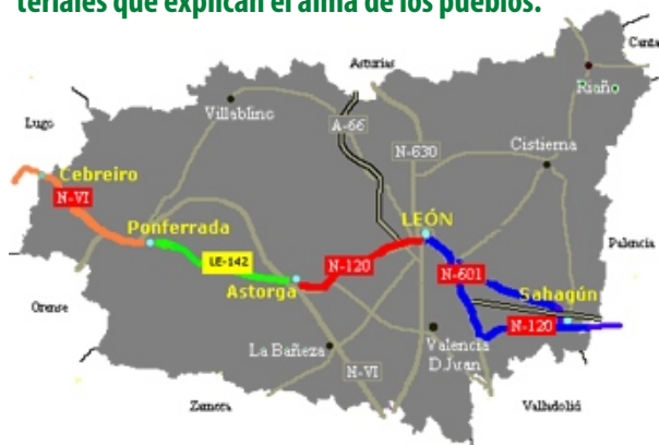
Mapa de un tramo del Camino de Santiago en España

"Además de una realidad de carácter material, los itinerarios culturales entrañan un elemento dinamizador que actúa como un hilo conductor o cauce a través del cual han fluido los vasos comunicantes del proceso civilizador. En su seno, y a lo largo de la historia, se han producido múltiples flujos y reflujos con aportaciones enriquecedoras para el conjunto, emanadas desde los diversos puntos de su recorrido. Ese fluido vital de la cultura se manifiesta en el espíritu y las tradiciones que constituyen el patrimonio intangible de los itinerarios culturales. Así, junto a los bienes patrimoniales de carácter material o tangible, dichos itinerarios representan un crisol de bienes inmateriales que explican el alma de los pueblos.