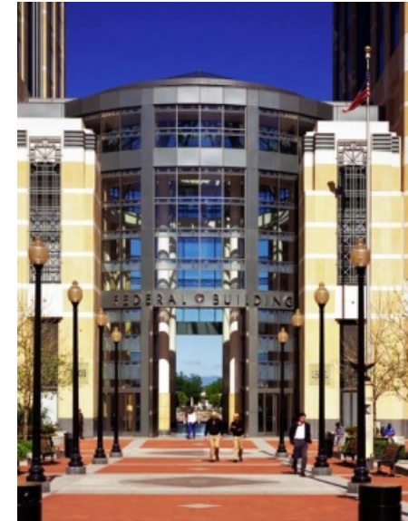
El camino de la entrada principal del Federal Building

El Edificio Federal de Oakland (California) es un elemento clave en la revitalización del centro de Oakland y un ejemplo de trabajo en la creación de lugares. La arquitectura simboliza la amplia caricia del renacimiento de la ciudad, y el diseño se ha vuelto la entrada figurativa y la pieza central de un nuevo perfil urbano. El complejo de 94500 m 2 ocupa dos manzanas y está diseñado para albergar más de 4000 empleados. Un grupo de edificios de 5 niveles, que rodea a dos torres de 18 pisos, incluyen un jardín de infantes, comercios, tribunales, centros de conferencias y una cafetería en la planta baja. Esencialmente, el Edificio Federal ha reconocido y orientado exitosamente la necesidad de crear